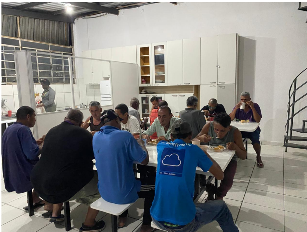
Figura 1: Lanche da Noite