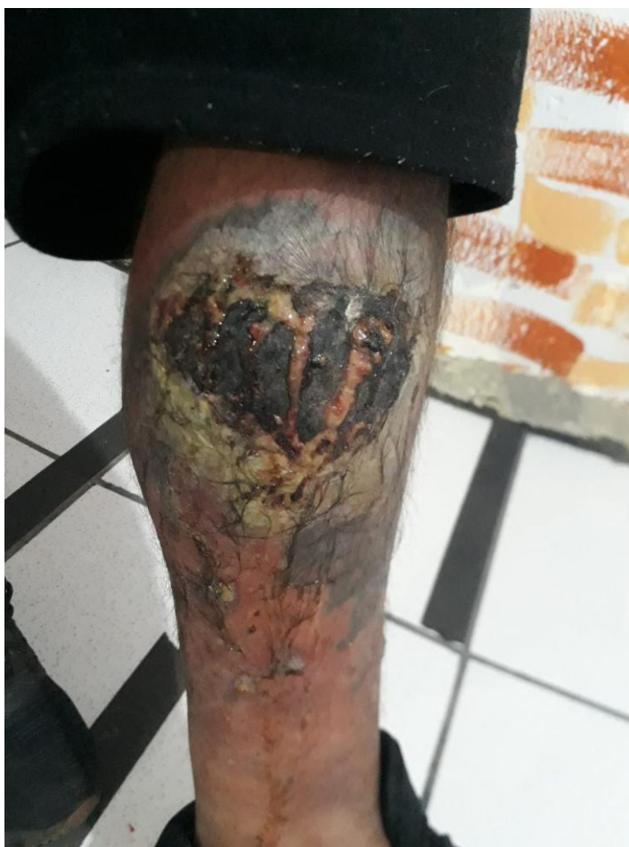
Figura 3: Situação que atendido chegou ao equipamento, após fazer uma tatuagem.