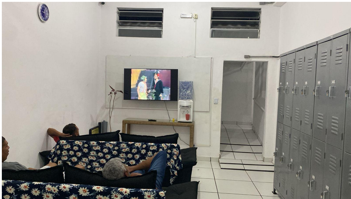
Figura 2: Descanso na sala de TV.